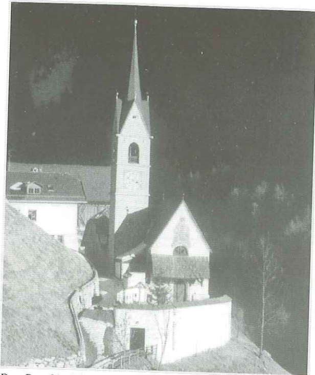
Das Bergkirchlein Mühlbach erstrahlt in frischen Farben

Im Monat September 1996 wurden am Turm in Mühlbach von der Firma Hubert Mayr aus Percha Restaurierungsarbeiten für einen Gesamtbetrag von Lire 32.000.000.- zur vollen Zufriedenheit der Bevölkerung durchgeführt.