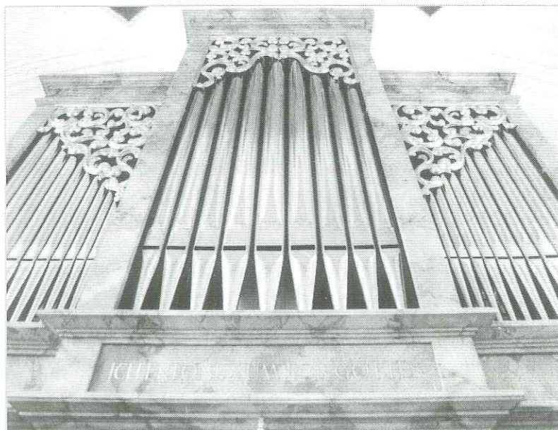
Die neue Orgel in der Pfarrkirche von Uttenheim

Für die Pfarrkirche von Uttenheim wurde eine mechanische Schleifladenorgel mit 8 Registern, verteilt auf ein Manual und Pedal, mit nachfolgender Disposition, erstellt.