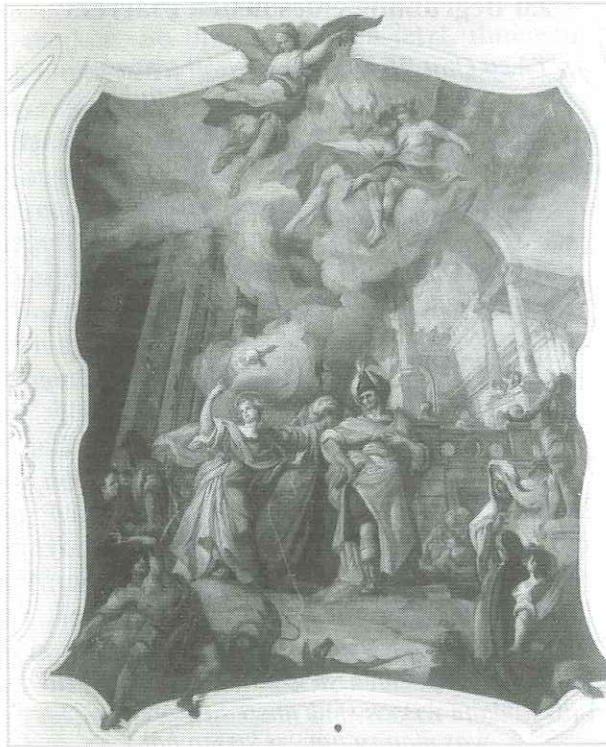
Das große Mittelbild nach der Restaurierung